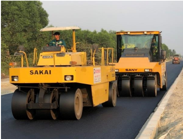
Thi công DA Đường Vành đai phía tây Đà Nẵng

- Một số hình ảnh tiêu biểu của các dự án Công ty đang thi công: