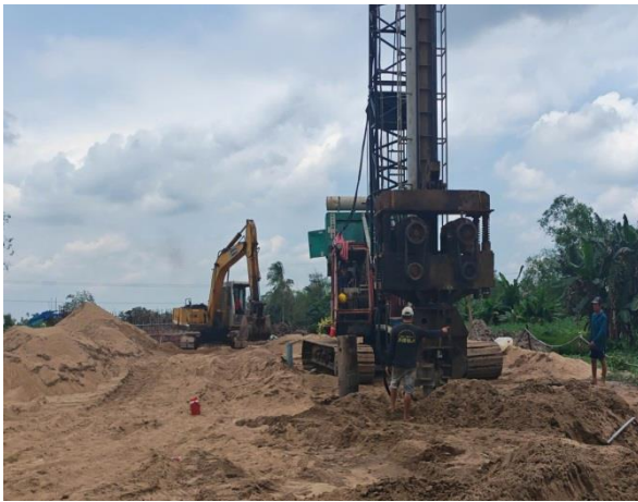
Thi công khoan cọc cát tại DA Tỉnh lộ 918 Cần Thơ