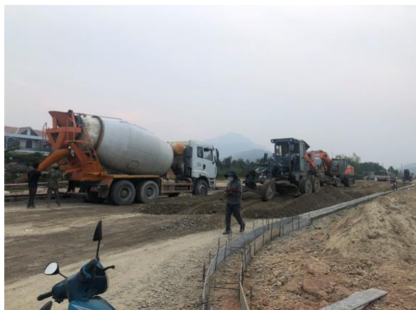
Dự án Đường Trường Sơn Đông (Gói 37G)