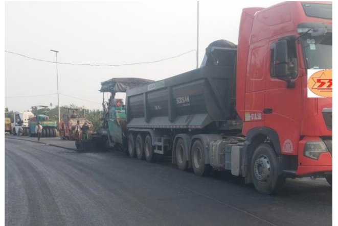
Thi công DA Hồ chứa nước ngọt Sông Láng Thè, Trà Vinh