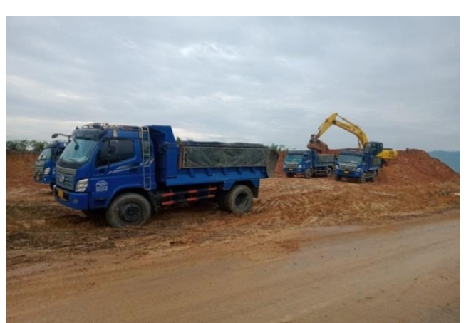
Khu TĐC Xã Hòa Phú, Hòa Vang, Đà Nẵng