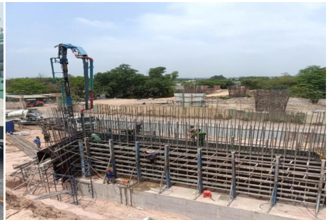
Thi công dự án Cao tốc Hòa Liên – Túy Loan thuộc cao tốc Bắc Nam phía Đông, Đà Nẵng